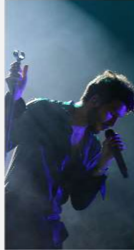
SHOWS NACIONALES E INTERNACIONALES