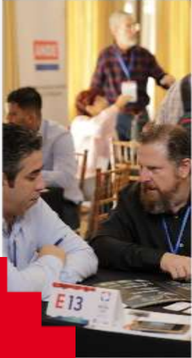
RUEDA DE NEGOCIOS